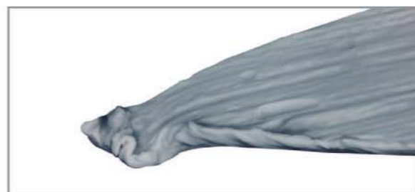
複数回使用の針先の写真