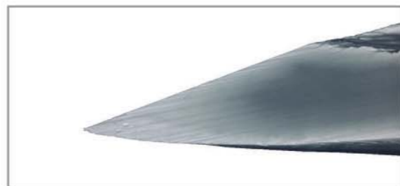
使用前の針先の写真