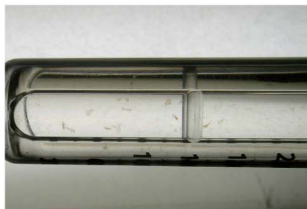
血液成分で浮遊物が生じたインスリン