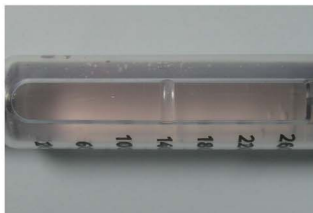
血液が逆流して赤色に変色したインスリン